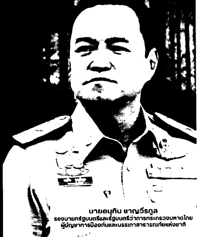
นายอนุทิน ชาญวีรกูล รองนายกรัฐมนตรีและรัฐมนตรีว่าการกระทรวงมหาดไทย ผู้บัญชาการป้องกันและบรรเทาสาธารณภัยแห่งชาติ